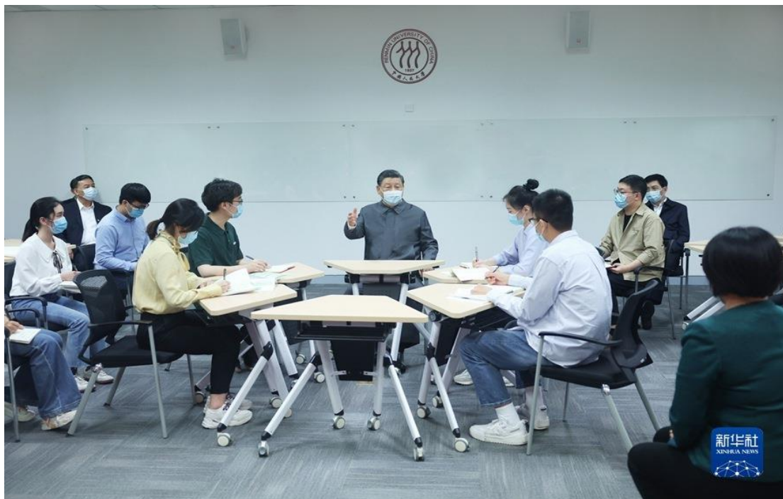
4月25日上午，中共中央总书记、国家主席、中央军委主席习近平来到中国人民大学考察调研。这是习近平在立德楼观摩思政课智慧教室现场教学并参与讨论。