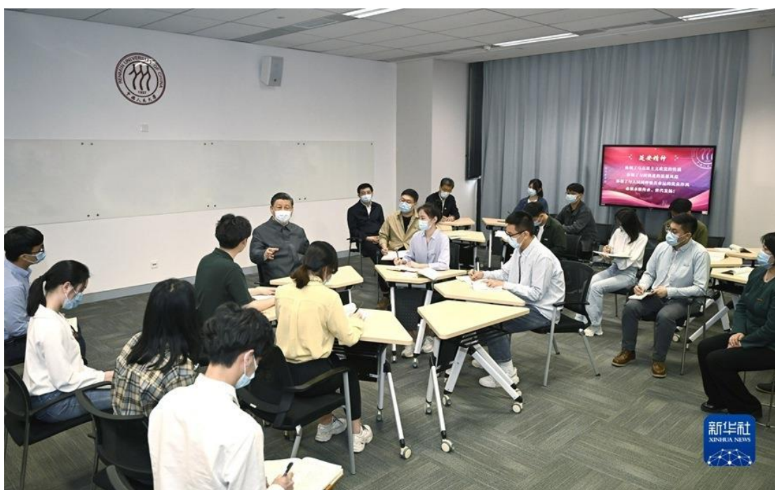
4月25日上午，中共中央总书记、国家主席、中央军委主席习近平来到中国人民大学考察调研。这是习近平在立德楼观摩思政课智慧教室现场教学并参与讨论。