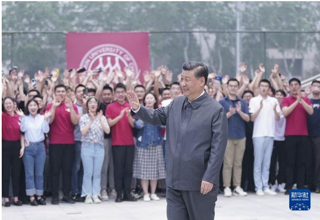
4月25日上午，中共中央总书记、国家主席、中央军委主席习近平来到中国人民大学考察调研。这是习近平向师生们挥手致意。

复兴重任的时代新人。希望广大青年用脚步丈量祖国大地，用眼睛发现中国精神，用耳朵倾听人民呼声，用内心感应时代脉搏，把对祖国血浓于水、与人民同呼吸共命运的情感贯穿学业全过程、融汇在事业追求中。