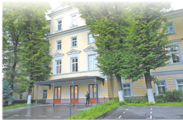
莫斯科中山大学旧址

100多年前，中华民族危亡之际，一批批热血青年远渡重洋，探索救国救民的真理。他们踏足西欧、日本、俄罗斯等国家和地区，学习新思想、新知识、新理念，其中许多优秀代表成长为坚定的马克思